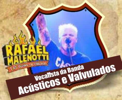
Vocalista da Banda Acústicos e Valvulados